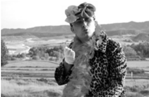
"Elecciones 2011". S.E.