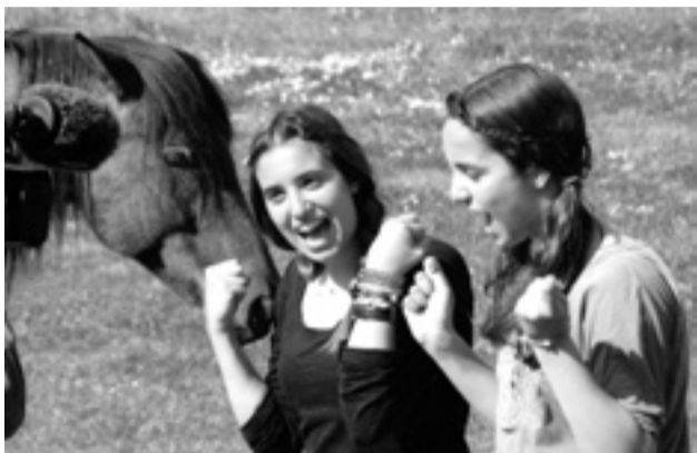
"Se llama amistad". S.E.