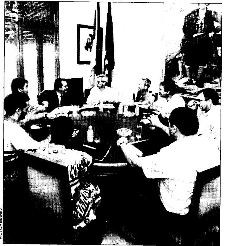
Imagen de la reunión del alcalde de Huesca con la Asociación de Comerciantes.

El alcalde estuvo de acuerdo con la petición de la Asociación de mantener y potenciar la mesa del Comercio creada con la anterior corporación. Sobre la mesa también se puso la necesidad de modificar algunas ordenanzas, la ayuda al comercio y adoptar medidas de tráfico y seguridad ciudadana. En este sentido, Acín indicó que "nuestra intención es que, entre el 16 de agosto y