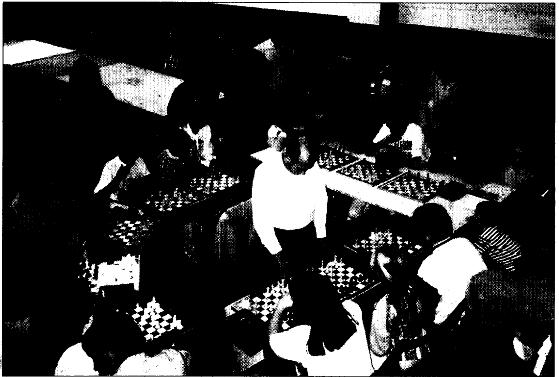
La Semana Grande de Ajedrez en Villanueva de Sijena contó con una gran participación.

El torneo, organizado por el Club Amistad Sijenense, tuvo lugar en Villanueva de Sijena